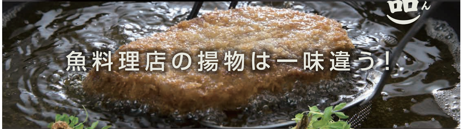
メカジキフライ 1,000円(税込)