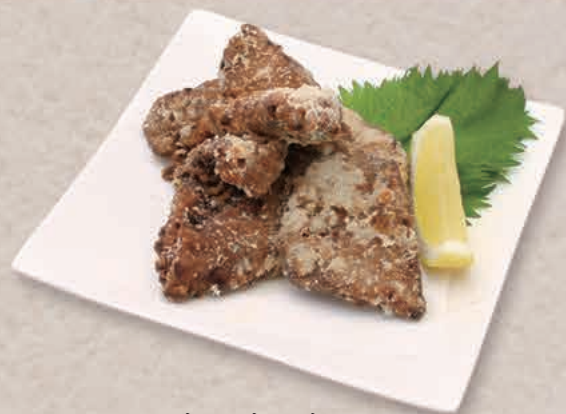
たつ た あ まぐろの竜田揚げ 850円(税込)