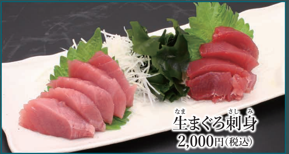
なま さしみ 生まぐる刺身 2,000円(税込)