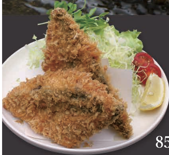
さばフライ 850円(税込)