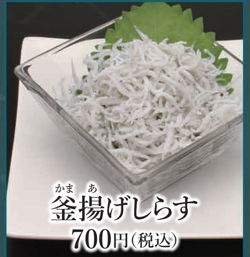
かまあ 釜揚げしらす 700円(税込)