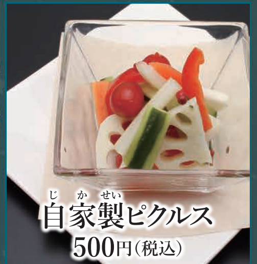
じかせい 自家製ピクルス 500円(税込)