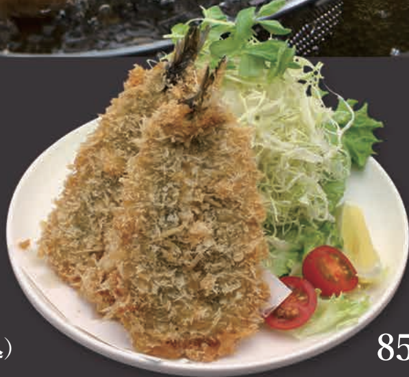
いわしフライ 850円(税込)