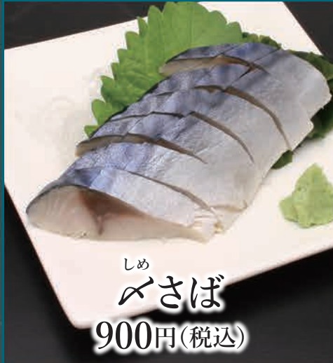
しめ べさば 900円(税込)