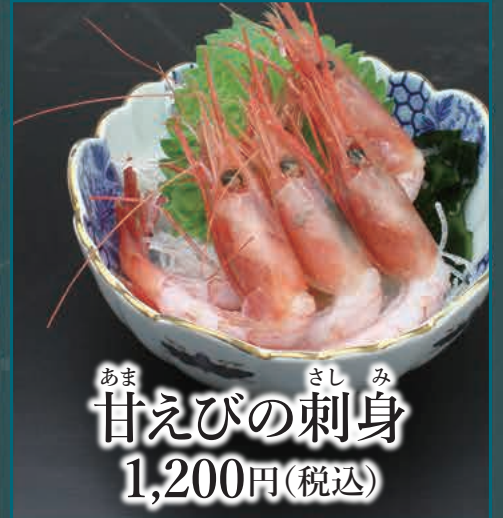
あま さしみ 甘えびの刺身 1,200円(税込)