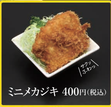
ミニメカジキ 400円(税込)