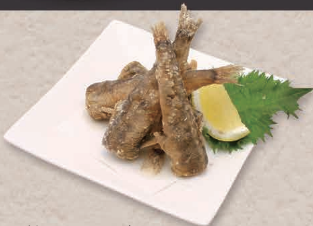
めひかり あ 目光のから揚げ 850円(税込)