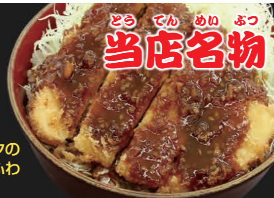
メカジキのソースかつ丼 2,500円(税込)