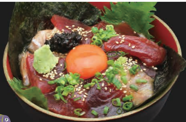
近海生まぐろユッケ丼 2,600円(税込)