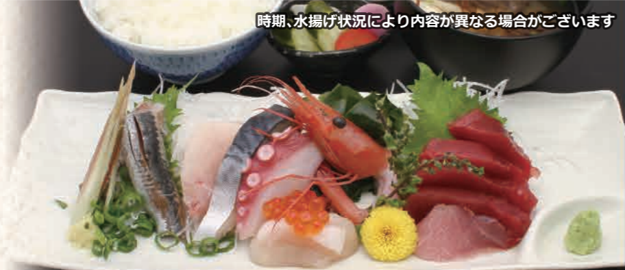
銚子港水揚げの新鮮なお魚をどうぞ 地魚刺身定食 2,900円(税込)