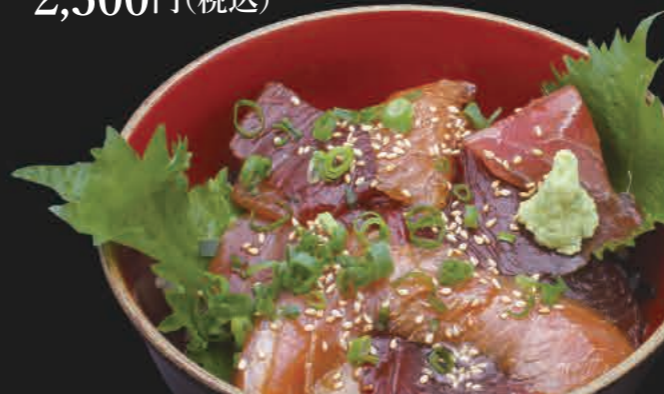
近海生まぐろ漬け丼 2,500円(税込)