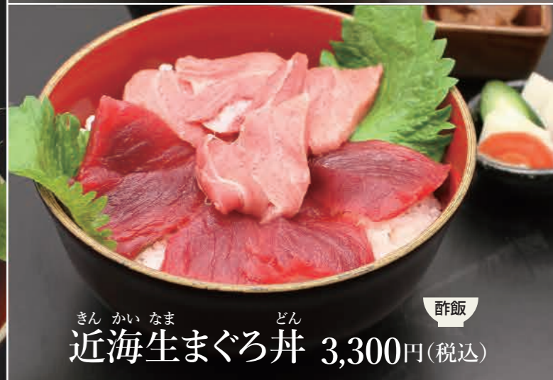
近海生まぐろ丼 3,300円(税込)