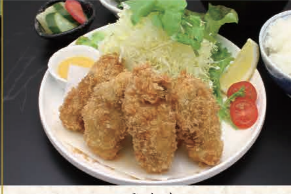
かきフライ定食 2,300円(税込)