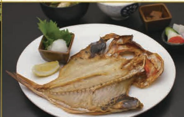
銚子つりきんめ干物定食 3,400円(税込)