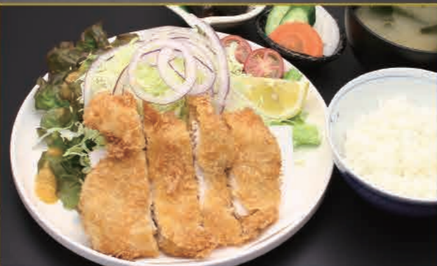
メカジキフライ定食 2,500円(税込)