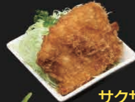
ミニメカジキフライ 700円(税込)