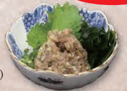
なめろう 1,200円 (無くなり次第終了)