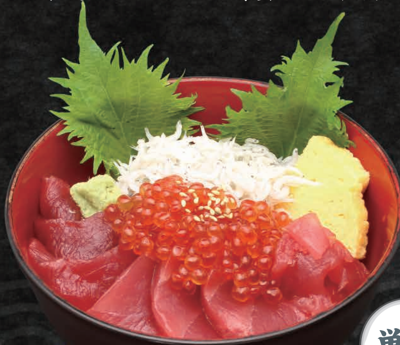
近海生まぐろ井 3,300円 (汁付き)