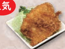
ミニメカジキフライ 700円

※お品切れの際はご容赦くださいませ ※水揚げ状況により、内容が変更となる場合がございます